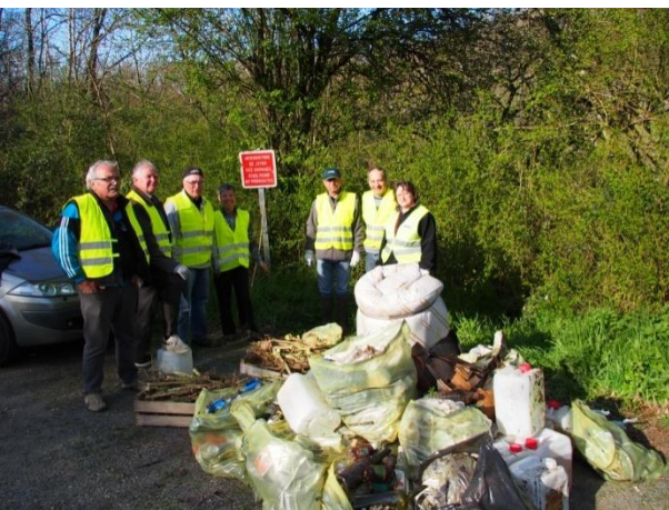
Collecte de déchets « sauvages » lors de la Journée Nature du 11 avril

Organisation OMEPS Arthès 17 octobre 2015