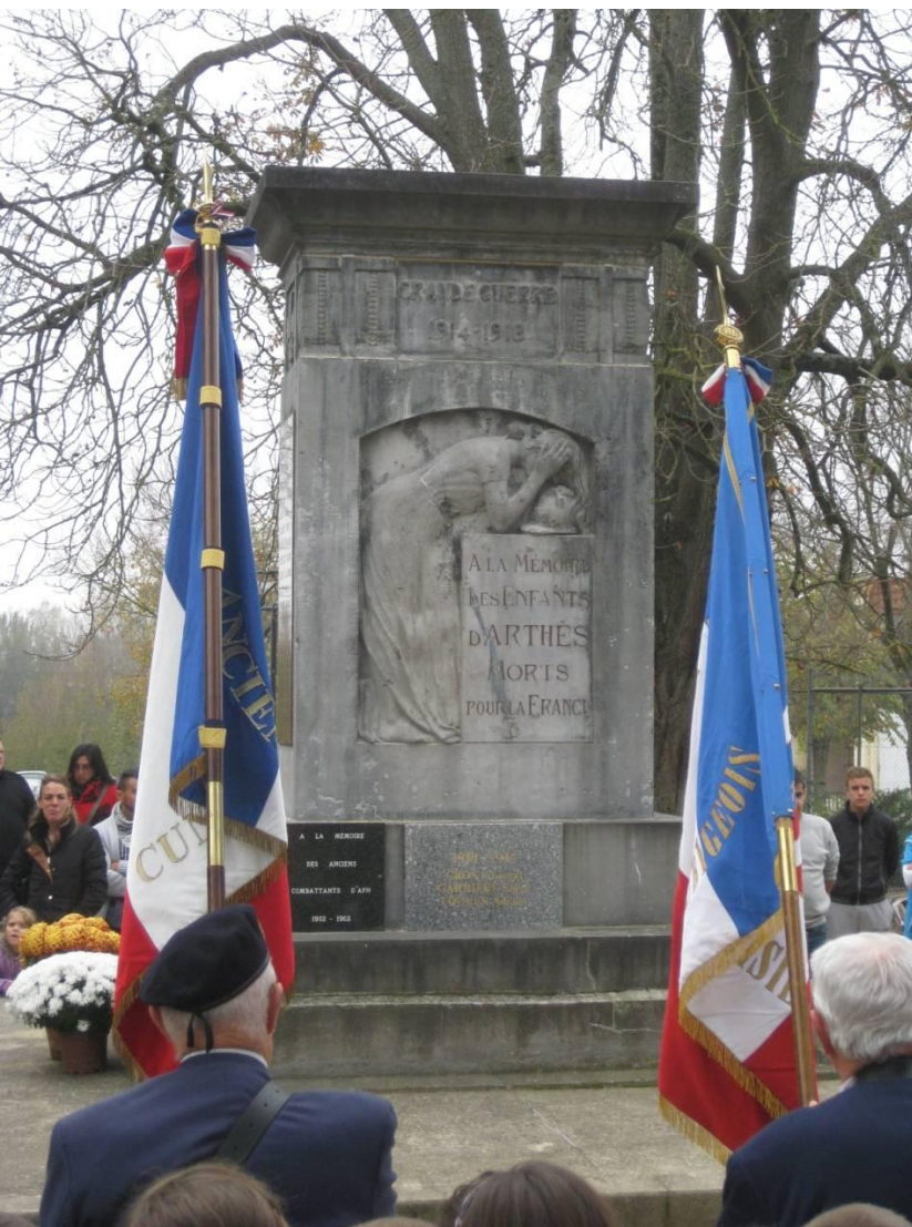
Recueillement devant le monument aux morts