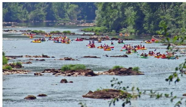
« Armada » de canoës voguant vers les Avalats lors de l'Arthésienne