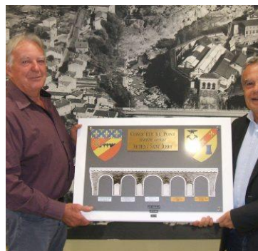
Saint-Juéry remet le trophée 2015 du Challenge du Pont à la ville d'Arthès

Organisation OMEPS Arthès 17 octobre 2015