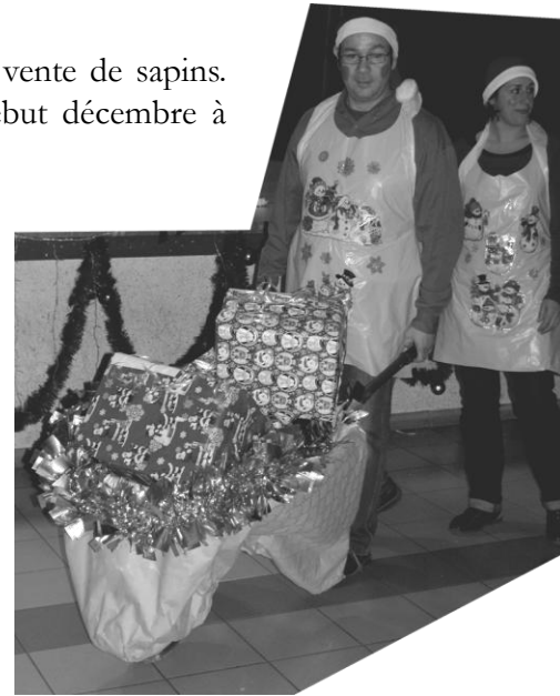
M. Et M me « Père Noël » avec leur hotte roulante

Sans votre participation, l'APE ne pourrait pas soutenir les projets des écoles !