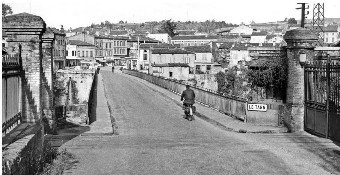
Le pont après un premier élargissement jusqu'en novembre 1963.....

Bulletin Municipal « La Voix du Couderc » n°72 Décembre 2015 - chargé de publication : Commission Communication Impression mairie d'Arthès - Tirage : 1 200 exemplaires