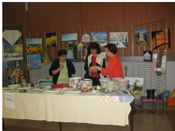
Le stand étoffé des « doigts arthésiens » lors de la journée Créations et Loisirs