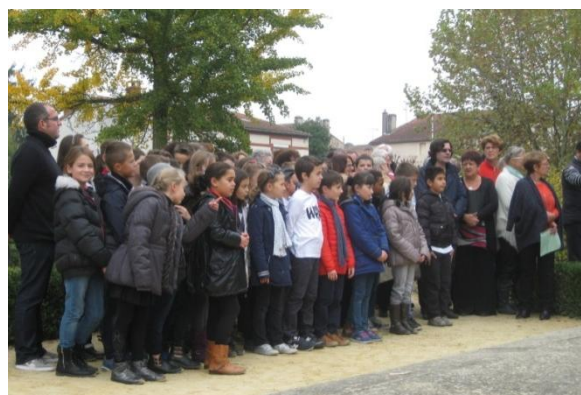
Enfants de l'école primaire chantant la Marseillaise lors de la cérémonie du 11 novembre