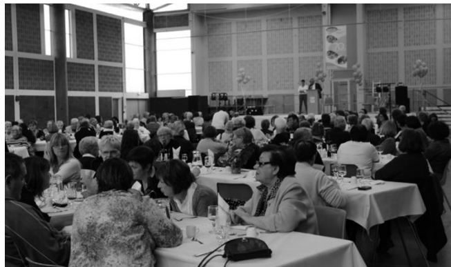
Une partie de l'assemblée durant le repas

Chacun a pu découvrir ou redécouvrir l'AASSODAL et ses divers services, mais également passer un moment agréable et convivial. Après avoir partagé un délicieux repas, la journée s'est terminée par une représentation théâtrale sur le thème des aidants.