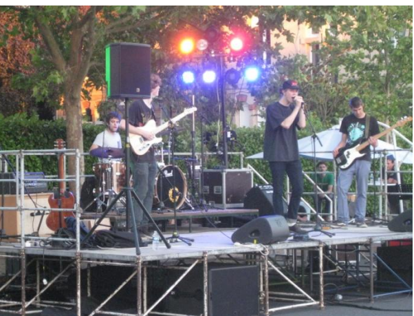
Première fête de la Musique en juin