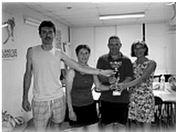
TC Arthès 1, équipe de doubles vainqueur

Après avoir bien savouré cette victoire tous les adhérents ont largement utilisé les raquettes pendant les congés d'été.....puis septembre était là.