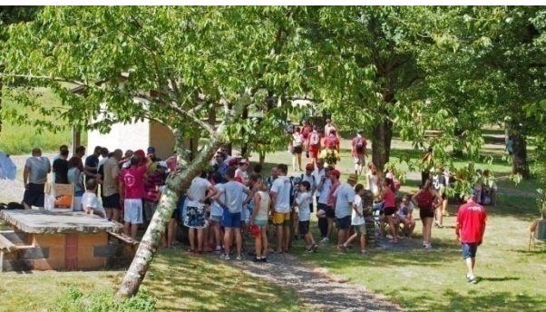
Pique-nique géant à l'aire de la Condamine proche d'Ambialet