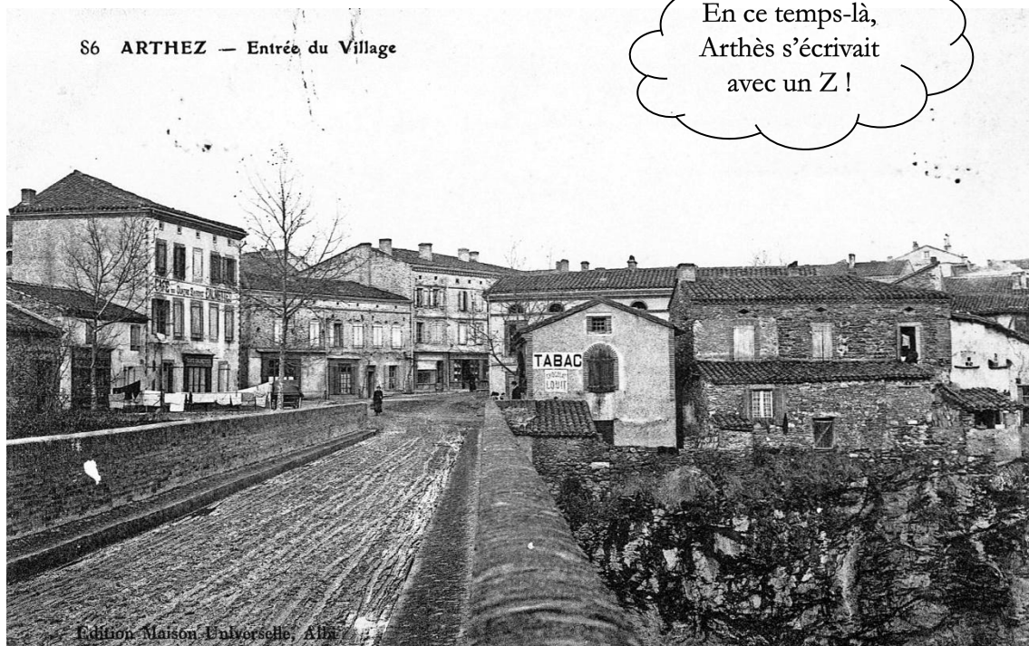
Le pont dans sa première version avec parapets bâtis en briques.....