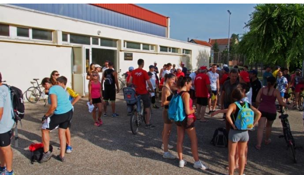
Les préparatifs avant le départ des participants de l'Arthésienne