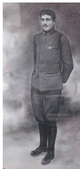
Soldat arthésien décoré de la «Croix de Guerre» en 1922